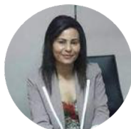
RICHE Many DG, Sodeico HR Solutions